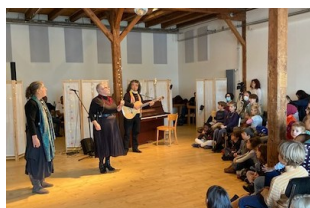
Spectacle Ramène ta chaussure, le 5 décembre 2021 à Fribourg

Ensuite, les ateliers de création participative « Quo vadis » (où vas-tu ?) ont encouragé des personnes d'ici et d'ailleurs — notamment des familles — à faire connaissance, à échanger de manière ludique sur différentes expériences de la Saint-Nicolas, puis à tisser des liens avec d'autres fêtes à la symbolique proche ; les participant·e·s ont, à leur tour, été invité·e·s à produire des objets artistiques autour du symbole de la chaussure. Le but ici était de partager les parcours de vie et de migration, ainsi que leur sentiment d'appartenance à un lieu.