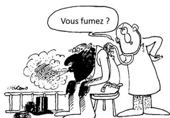
Figure 2. Les maladies professionnelles ne sont pas reconnues

La figure 2 illustre de manière humoristique cette problématique : un ramoneur va chez son médecin pour des problèmes respiratoires et la première question du médecin concerne le tabac et non la profession ! Il est intéressant de rappeler qu'il y a plus de 300 ans, le père de la médecine du travail, le médecin Bernardino Ramazzini, préconisait à ses collègues de poser toujours comme première question à leur patient : « Quel métier faites-vous ? ». Or, force est de constater que 300 ans plus tard, ce n'est toujours pas la première question du médecin !