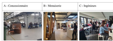
Fig 3 - Espaces de concerts dans les différentes entreprises

Finalement, il apparaît qu'assister aux concerts dans un espace déconnecté des postes de travail usuels encourage l'adoption des interventions musicales. Cela a été le cas pour les menuisier·e·s et les ingénieur·e, dont respectivement le showroom et l'espace de pause ont été reconvertis pour accueillir le piano et les interludes. Ces pauses permettent un effet de coupure et de reprise de soi.