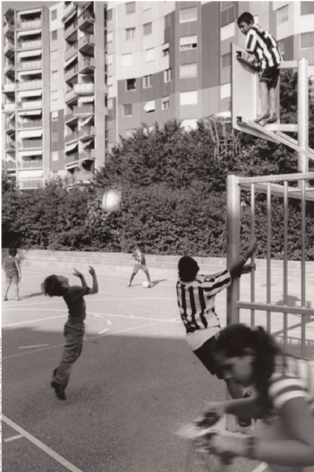
© Christian Lutz - Reportage aux Avanchets - Genève septembre 2005