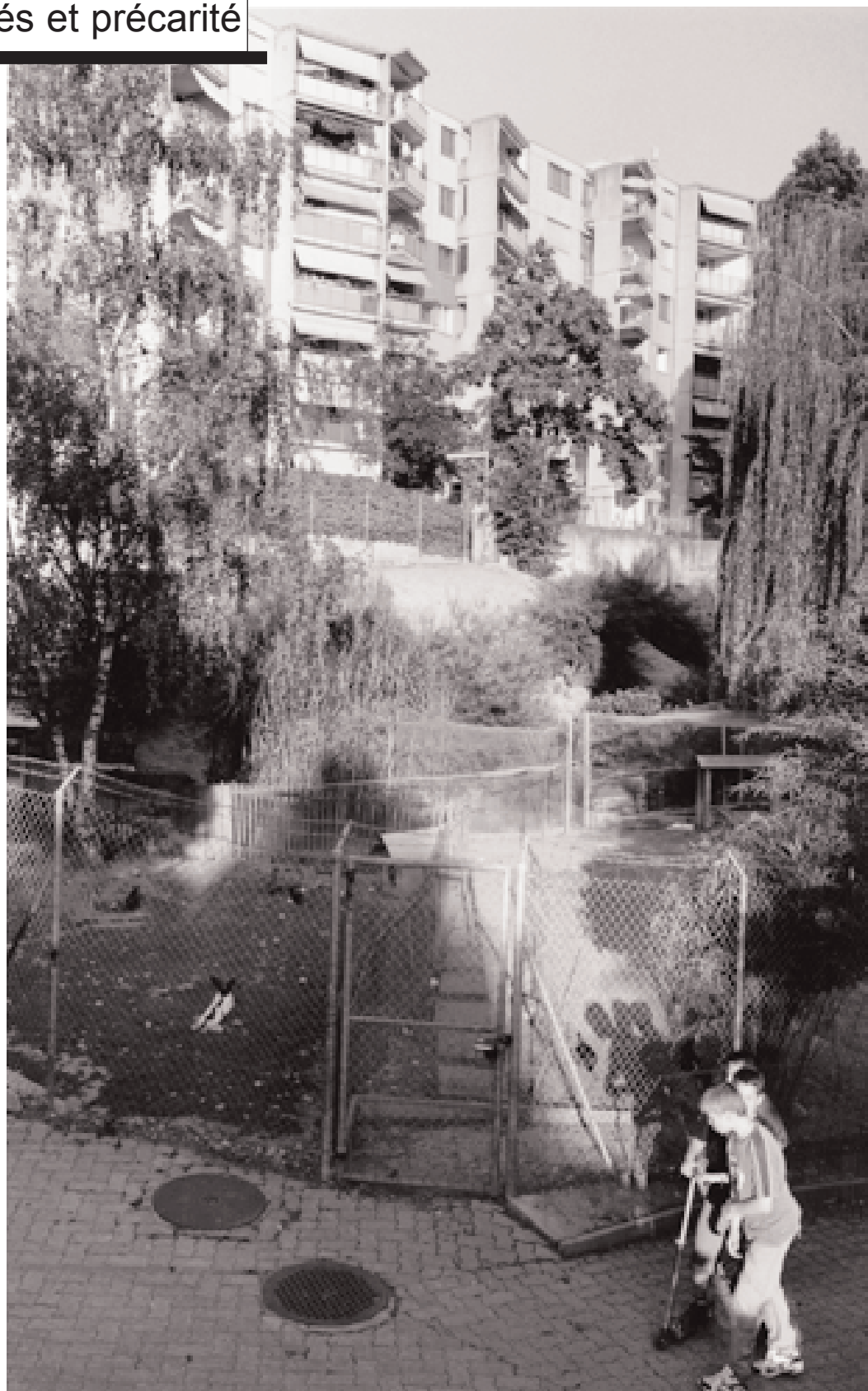
© Christian Lutz – Reportage aux Avanchets – Genève septembre 2005

«Plus jamais une telle concentration de logements HBM dans un même immeuble», Ernest Greiner.