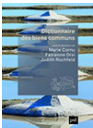
Dictionnaire des biens communs