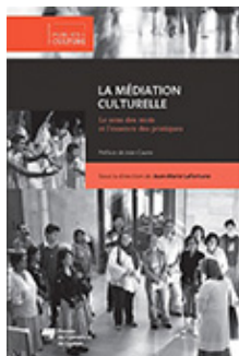
Lafortune, Jean-Marie (sous la dir.)

L'objectif, développer une meilleure gestion individuelle du stress s'insérant dans un cadre collectif d'intervention, permet une amélioration graduelle du bien-être des professionnels et des personnes qu'ils accompagnent au quotidien.