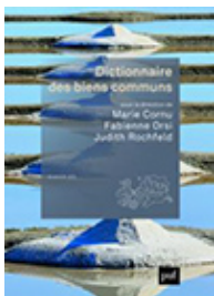
Dictionnaire des biens communs